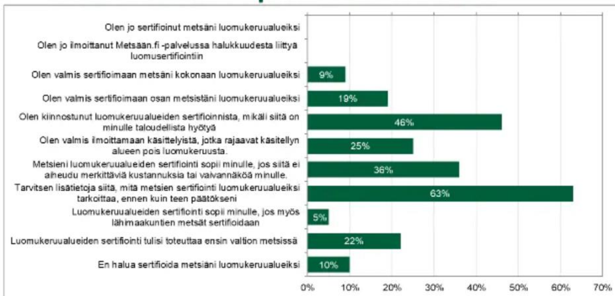
Kuva 3. Metsäomistajien vastaukset LuMe -kyselystä Keski-Suomessa ja Keski-Pohjanmaalla (Luomukeruusertifiointi tunnetuksi metsänomistajille verkkoseminaari 8.12.2020, Suomen metsäkeskus).