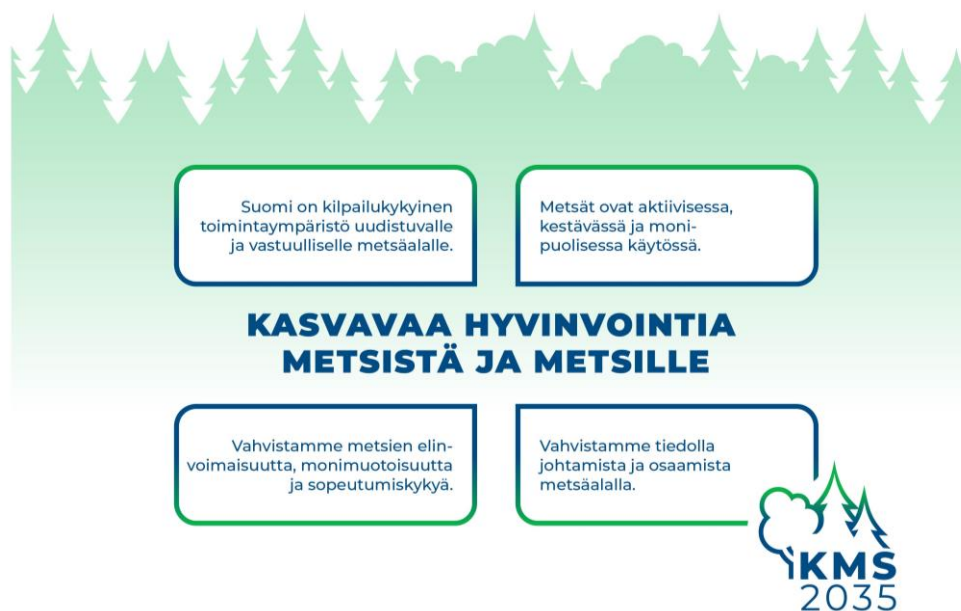
Kuvio 4. Metsästrategian visio ja päämäärät.