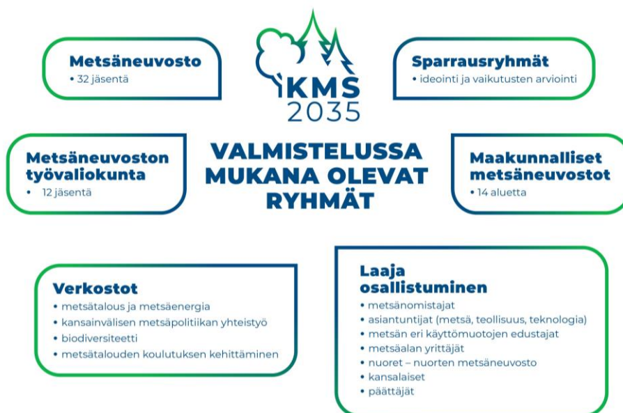
Kuvio 1. Metsästrategian valmisteluun osallistuneet ryhmät.

Kansallinen metsästrategia on yhteensovittava elinkeinostrategia, jossa otetaan huomioon niin ihminen, ympäristö kuin talous. Se kattaa metsätalouden ja -teollisuuden lisäksi myös metsien muihin sekä aineellisiin että aineettomiin tuotteisiin perustuvan tuotannon, jalostuksen, palvelut ja julkishyödykkeet sekä metsäalan osaamis- ja koulutuskysymykset. Strategialla on liittymäkohtia useisiin kansainvälisiin ja kansallisiin strategioihin ja ohjelmiin. Kansainväliset sekä EU:n metsä-, energia- ja ympäristöpoliittiset sitoumukset ja sopimukset vaikuttavat merkittävästi Suomen metsäsektoriin. Yhdistyneiden kansakuntien (YK) prosesseissa muotoutuu, millaisen roolin metsät maailmanlaajuisesti saavat tulevaisuuden haasteiden ratkonnassa. Suomi on sitoutunut ekologisesti, taloudellisesti ja sosiaalisesti kestävään kehitykseen (Agenda 2030-toimintaohjelma).