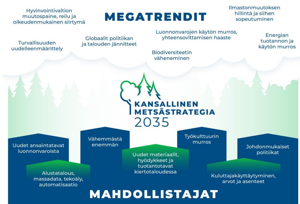
Kuvio 2. Metsäalaa vaikuttavia megatrendejä ja mahdollistajia.

Muutostekijöiden tunnistaminen ja ennakointi on haasteellista, mutta silti välttämätöntä (kuvio 2). Kehittämistoimenpiteiden osuvuus edellyttää, että pyritään systemaattisesti tunnistamaan metsäalaa liittyviä epävarmuuksia ja riskejä sekä niiden vaikutuksia.