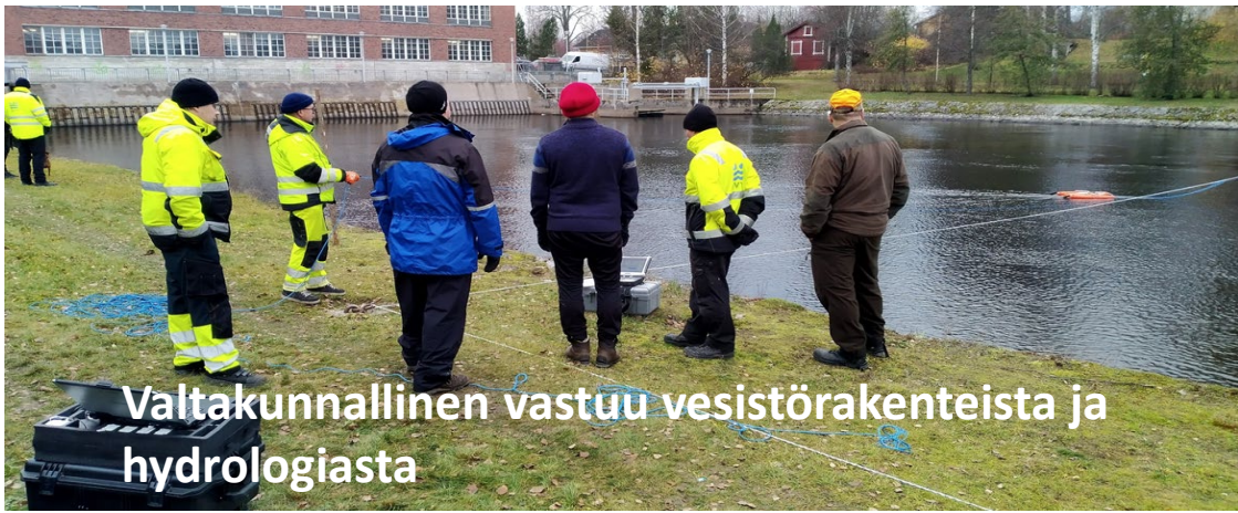
Valtakunnallinen vastuu vesistörakenteista ja hydrologiasta