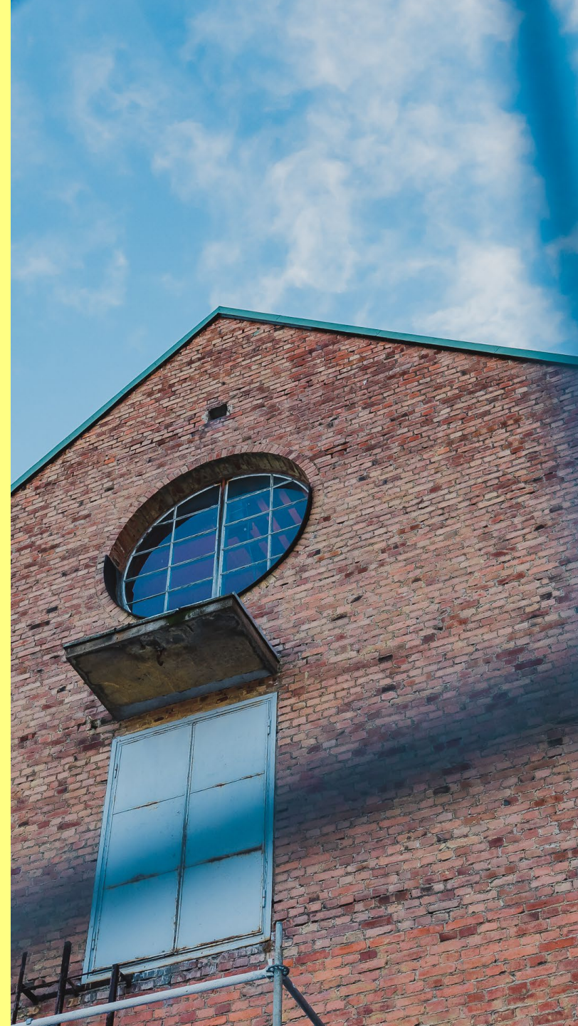
Taide- ja kulttuurikeskus 2020