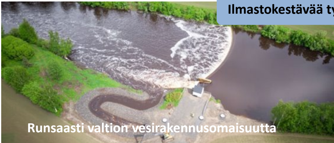
Runsaasti valtion vesirakennusomaisuutta

Ilmastokestävää työtä ympäristön hyväksi