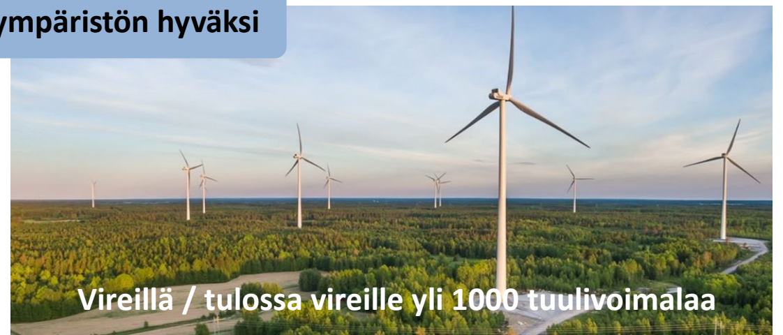
Vireillä / tulossa vireille yli 1000 tuulivoimalaa

Ilmastokestävää työtä ympäristön hyväksi