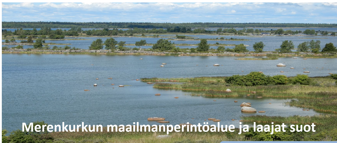
Merenkurkun maailmanperintöalue ja laajat suot