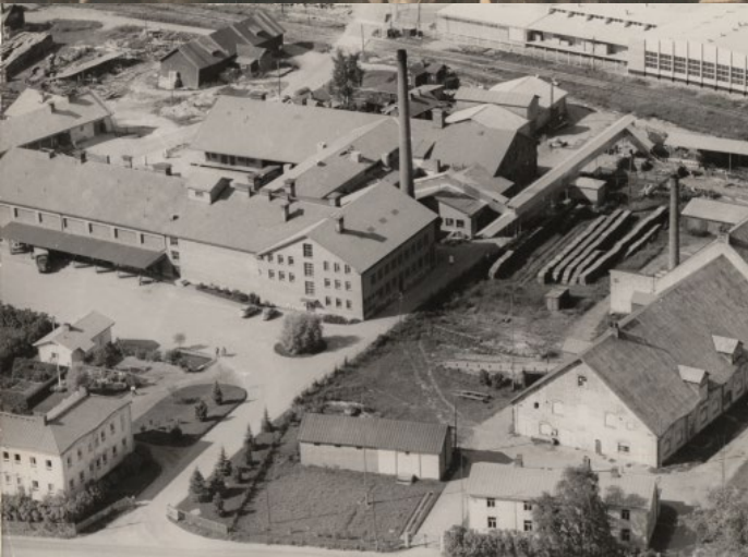
Itikanmäen kortteli 2011