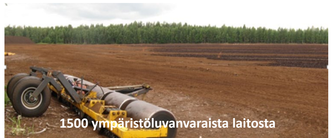
1500 ympäristöluvanvaraista laitosta