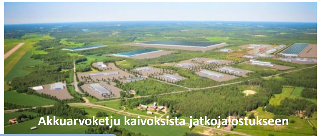
Akkuarvoketju kaivoksista jatkojalostukseen