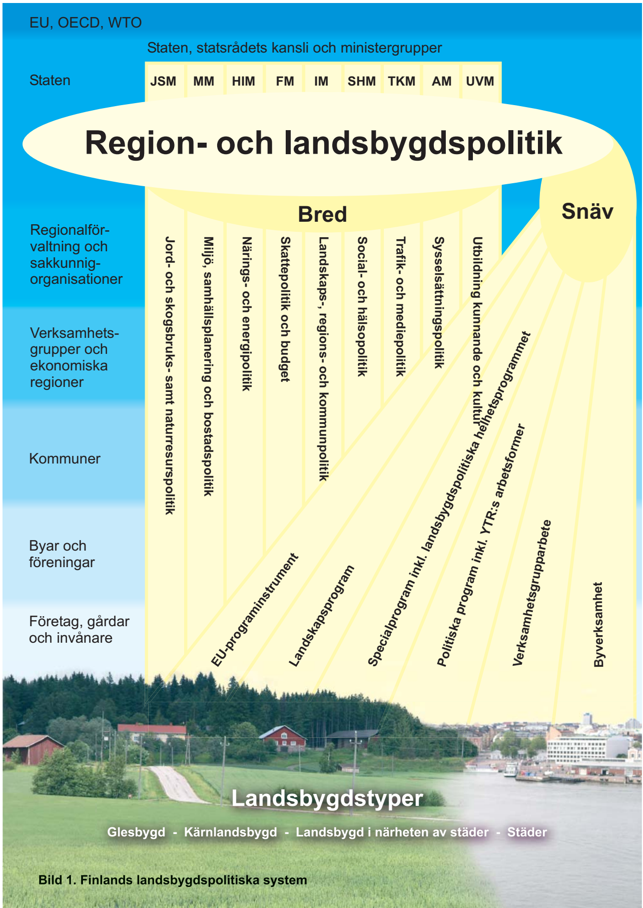
Bild 1. Finlands landsbygdspolitiska system