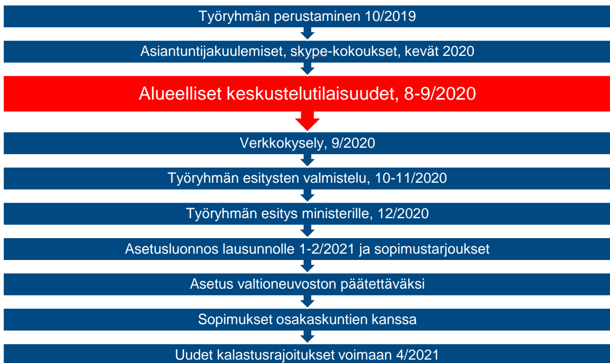
Kuva 1. Vuonna 2021 voimaan tulevien kalastussääntöjen valmisteluajataulu

Keskustelun teemana oli kalastusrajoitusten sisältö ja niiden alueellinen ulottuvuus. Maa- ja metsätalousministeriön asettama työryhmä käyttää keskustelun tuloksia kalastusrajoitusten uudistamistyössä. Keskustelutilaisuudet ovat osa vuonna 2021 voimaan tulevien kalastussääntöjen valmistelua.