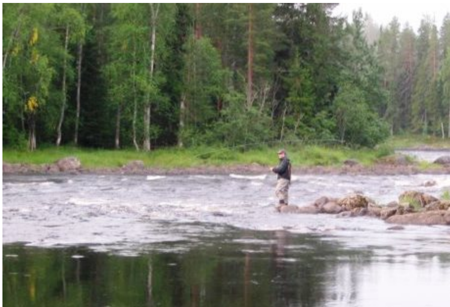
Kuva 2: Tässä kalastetaan vaelluskalavesistöön kuuluvan vesialueen koski- ja virta-alueella. Alueella kalastamiseen tarvitaan erillinen lupa.