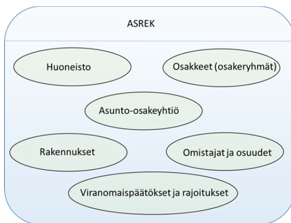
Kuva 1. Asunto-osakerekisterin keskeiset tietoryhmät

Sähköisellä asunto-osakerekisterillä tarkoitetaan uutta rekisteri- ja palvelukokonaisuutta, jonka avulla voidaan rekisteröidä osakehuoneistoja koskevat tiedot ja omistajamerkinnot sähköisesti sekä tukea uusien digitaalisten palvelujen kehittymistä. ASREK-järjestelmään liittyy osakeomistuksen sähköistämisen lisäksi tietoja useista jo olemassa olevista tietovarannoista. Asunto-osakerekisteri (ASREK) muodostaa perusrekisteriluonteisen loogisen kokonaisuuden asuntojen ja asunto-osakeyhtiöiden teknisistä ja taloudellisista tiedoista.