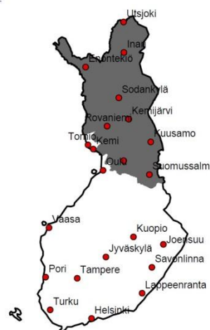
Puásituáluávlui 122 936 km 2