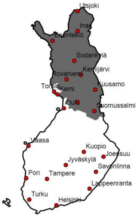
Boazodoalloguovlu 122 936 km 2