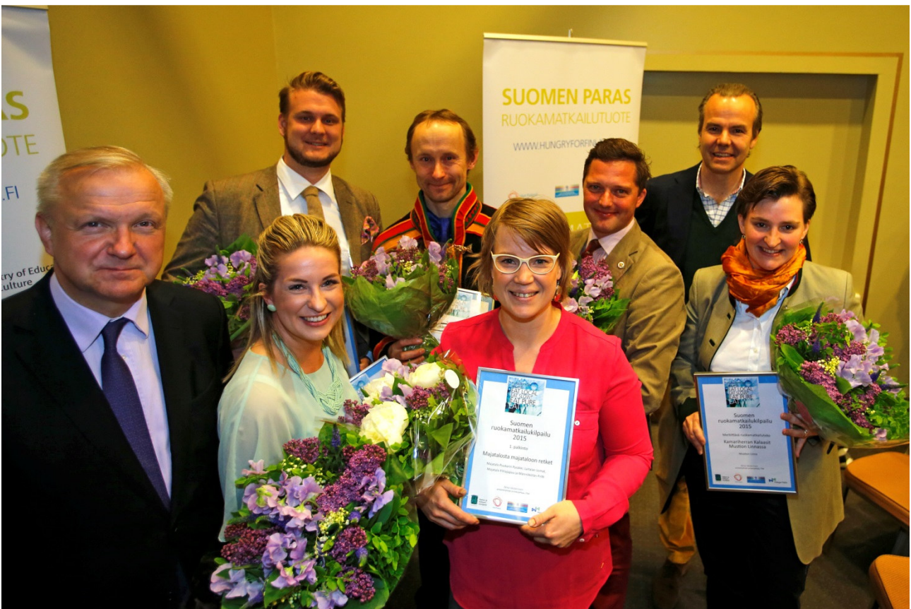
Suomen ensimmäisen ruokamatkailutuote -kilpailun voittaja, finalistit ja kunniamaininnan saaneet hymyilevät yhteiskuvassa palkinnon jakaneen ministeri Olli Rehnin kanssa.

Ruokamatkailua koskeva toimenpide voidaan katsoa toteutuneeksi täysimääräisesti. Ala on laatinut tavoitetilat ja toimenpiteet sisältävän ruokamatkailustrategian ja ruoka on kirjattu osaksi matkailun strategiaa kansallisia asiakirjoja. Ruokamatkailustrategian jalkauttaminen ja tuotevalikoimien laajentaminen vaativat kuitenkin edelleen työtä.