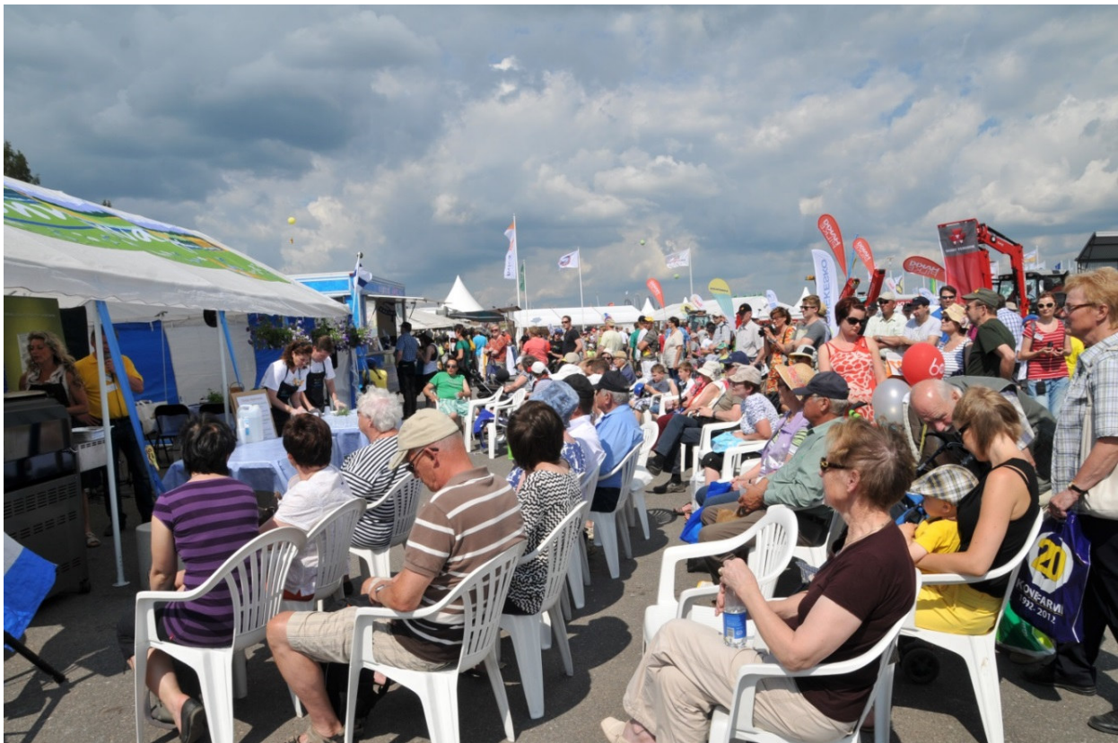
MMM:n lähiruoka- ja luomuaiheiset grillausnäytökset vetivät väkeä OKRA:ssa.

Lähiruokaohjelma on ollut esillä maa- ja metsätalousministeriön osastoilla Oripään OKRA-maatalousnäyttelyssä vuosina 2012 ja 2014, Seinäjoen Farmari-messuilla vuonna 2013 ja Herkkujen Suomi-tapahtumissa 2012, 2013 ja 2014. Osastoilla on jaettu painettua lähiruokaohjelmaa, esitteitä, kortteja ja kyniä. Konseptiin ovat kuuluneet myös maa- ja metsätalousministeriön grillausnäytökset, joissa grillaajiksi on kutsuttu lähiruoan tuottajia, julkisuuden henkilöitä, poliitikkoja ja muita ruokaketjun vaikuttajia keskustelemaan ruokasektorin ajankohtaisista asioista. Näissä grillauksissa lähiruoka on ollut yksi kantavista teemoista. OKRA-maatalousnäyttelyssä oli MMM:n osaston omalla lavalla ja näyttelyn päälavalla myös lähiruokateemaisia alustuksia ja haastatteluja. Tilaisuuksissa tehtyjen mediahaastattelujen kautta lähiruokaohjelma ja -teema ovat saaneet runsaasti julkisuutta.