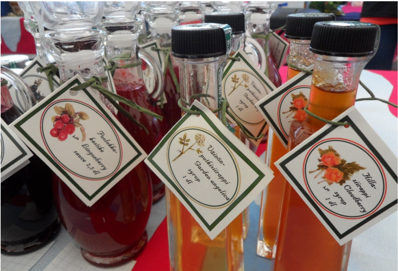
Lähiruokatuotteiden valikoima on laajentunut ja mm. luonnontuotteita jalostetaan yhä enemmän.