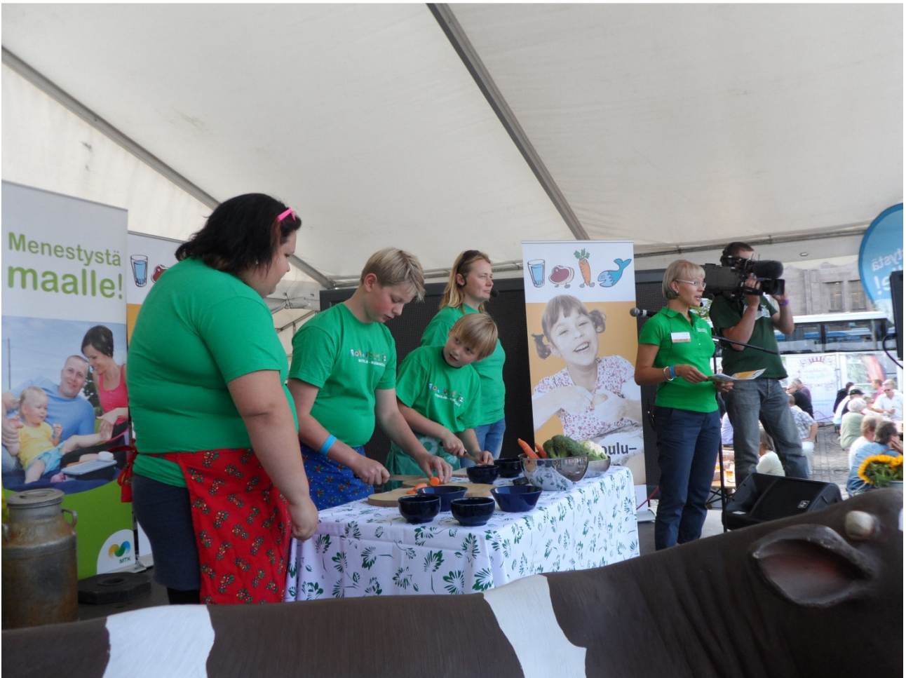
Ruokakoulu–Matskolan-hanke toi lapsia ja nuoria kokkaamaan myös Herkkujen Suomi -tapahtumaan vuonna 2013.