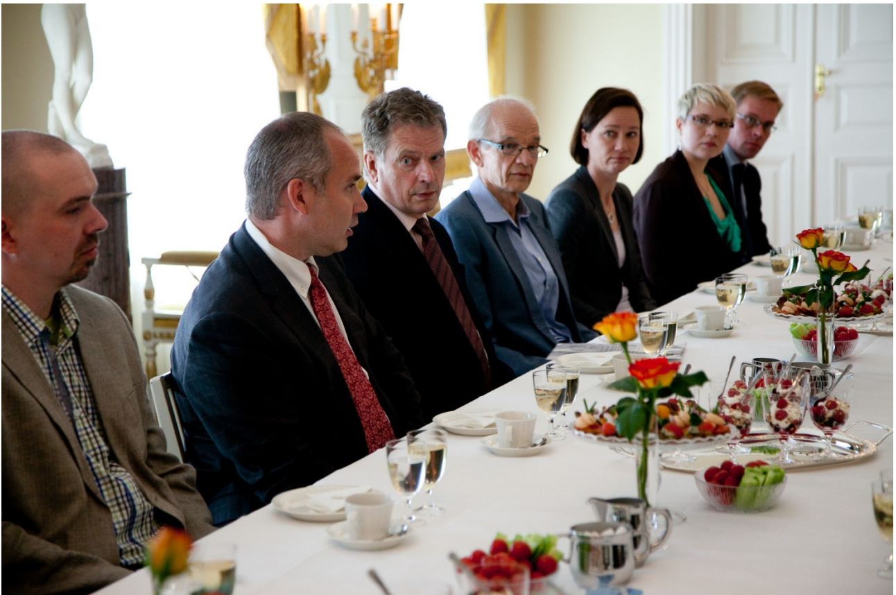
Ruokaryhmä tapaamassa tasavallan presidenttiä.

Lähirookaan liittyviä eduskunnan kirjallisia kysymyksiä on ollut vaalikaudella 2011–2015 kuusi. Niihin vastaamisen lisäksi on osallistuttu kolmeen eduskunnassa pidettyyn kuulemiseen tai muuhun tapaamiseen.