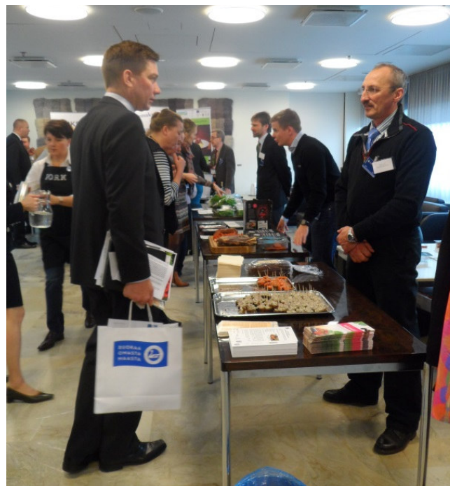
Eduskunnan lähiuokapäivä vuonna 2013.

Vuonna 2014 Lähiuokapäivä järjestettiin Pikkuparlamentin tiloissa, jossa avoimen seminaarin lisäksi oli esittelystäännejä tuotejakeluineen. Vuoden 2014 tilaisuuden yhteydessä postitettiin kansanedustajille lähiuokakoordinaattorin vetoomus lähiuokateeman edistämisestä vaalikaudella 2015–2019.