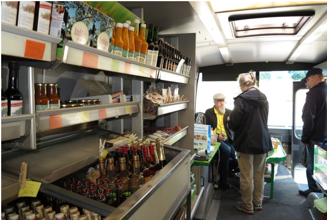
Vuoden 2014 Lähirookapäivässä lähiruokaa oli kaikkien ostettavissa Arkadiankadun kulmaan parkkeeratusta Lähirookakauppa-autosta. Kumpanakin vuotena Lähirookapäivä näkyi myös Eduskunnan ruokapalveluissa.

Lähirookapäivä 2014 sai yllätysvieraan, kun EU:n maatalouskomissaari Dacian Ciolos poikkesi neuvottelujen lomassa delegaationsa kanssa Lähirookapäivän infopisteille. Lähirookakoordinaattori luovutti komissarille ja delegaation jäsenille suomalaista kauraleipää ja muita tervehdyksiä sisältävät kassit. Lisäksi komissaari sai pikakatsauksen Suomen politiikkaan ja käytännön kehittämistyöhön lähiruokasektorilla.