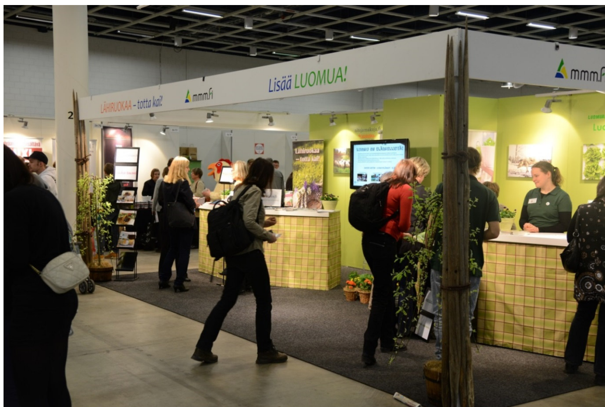
Lähiruoka ja luomu kiinnostivat messuosallistujia, kuva vuoden 2014 messuosastosta.