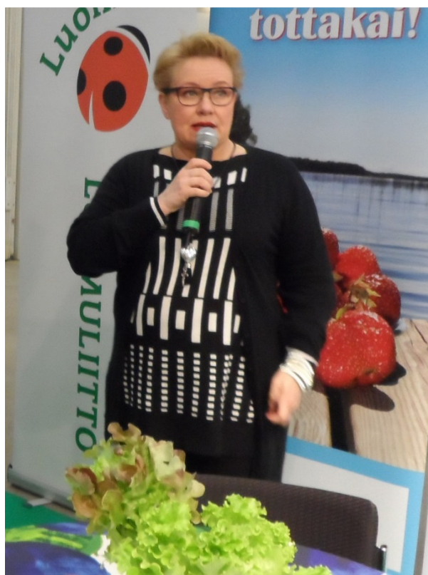
Europarlamentaarikko Sirpa Pietikäinen oli puhumassa maa- ja metsätalousministeriön osastolla Lähiruoka&Luomu -messuilla vuonna 2013.