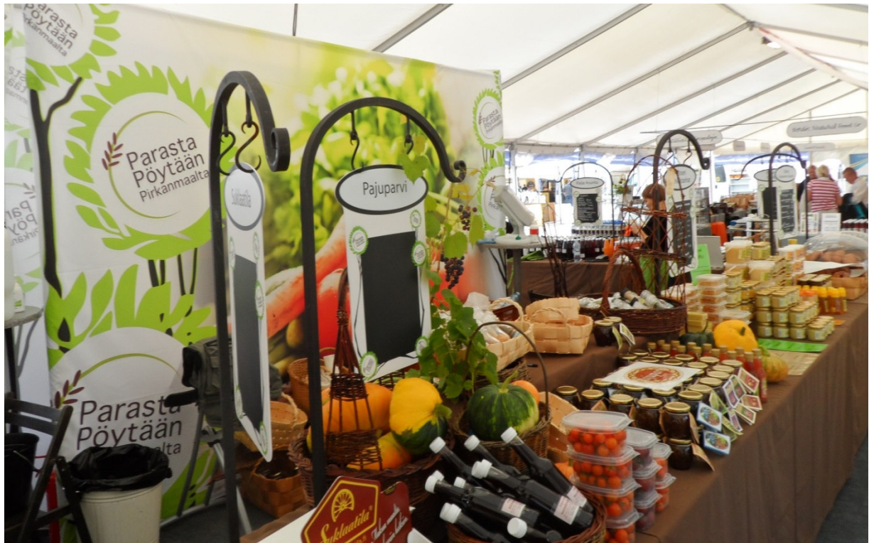
Hankkeiden avulla on kehitetty mm. markkinointiosaamista ja koottu alueellisia messuosastoja.