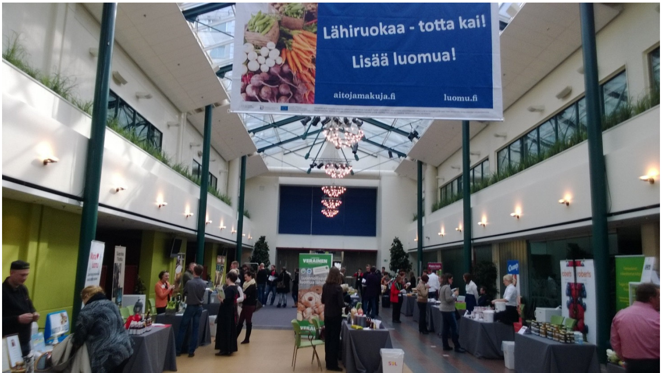
Paikallista ruokaa! -lähirookatreffit vuonna 2014.

Lähirookaohjelma järjesti Gastro2014-messujen yhteydessä 21.3.2014 Paikallista ruokaa! -lähirookatreffit yhteistyössä Aitojamakuja II -hankkeen ja Ruoka-Suomi-verkoston kanssa. Tilaisuuden tarkoituksena oli lisätä elintarvikealan pienempien yritysten tunnettuutta HoReCa-sektorin ammattilaisten keskuudessa. Tilaisuuden tarkoituksena oli myös tuoda alan ammattilaisille, HoReCa-toimijoille ja julkisen ruokapalvelun edustajille tutuksi pienyritysten tuotteita ja antaa yrityksille mahdollisuuksia päästä edellä mainittujen toimijoiden asiakkaisiksi. Tilaisuuteen esitettiin avoin kutsu, ja paikalle saapui yli 20 yritystä ympäri Suomea. Ammattios-tajia oli paikalla noin sata.