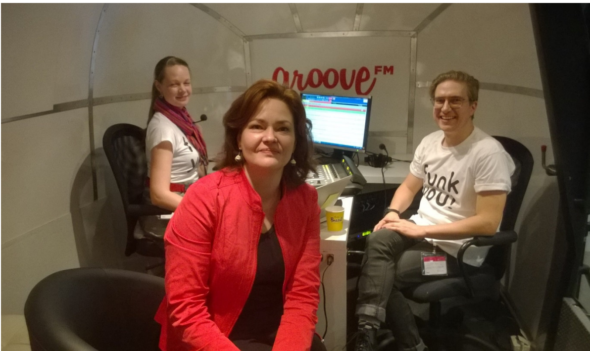
Groove FM lähetti lähiuoka-aiheisia haastatteluja suorana kevään 2015 Lähiuoka&Luomu-messuilta.