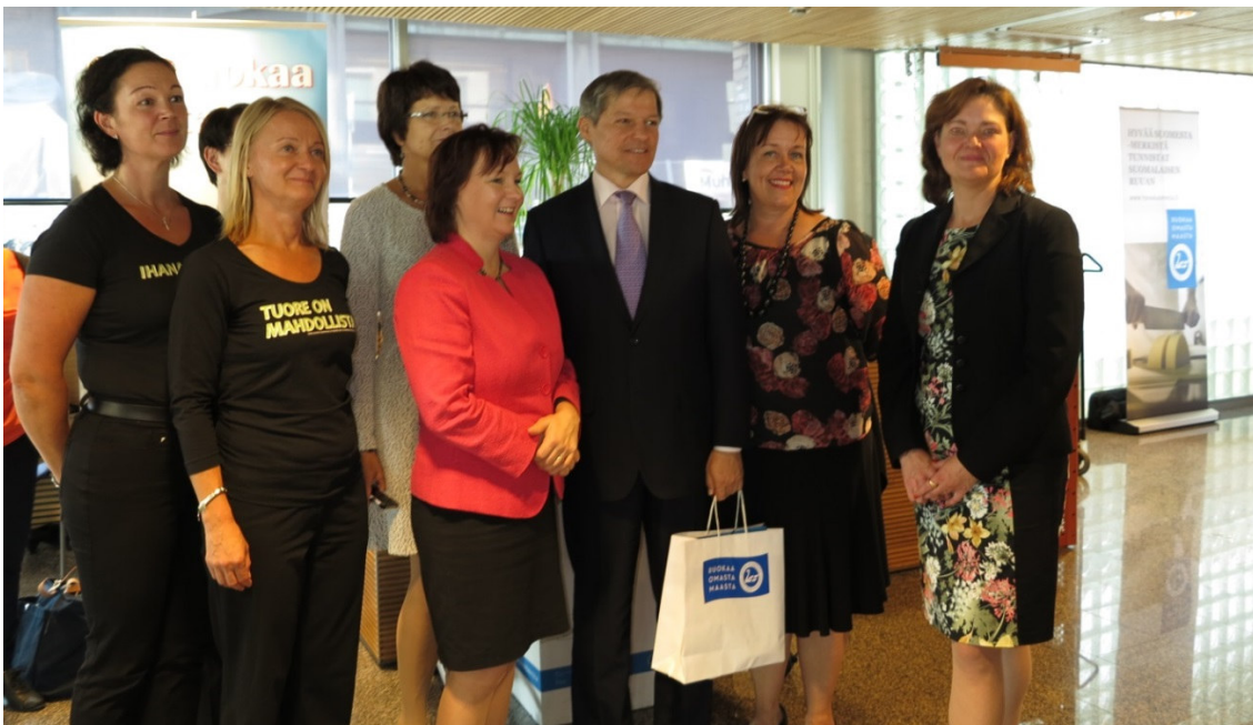
EU:n maatalouskomissaari Dacian Ciolos ja ruoka-alan toimijoita.

Lähirookapäivä 2014 sai yllätysvieraan, kun EU:n maatalouskomissaari Dacian Ciolos poikkesi neuvottelujen lomassa delegaationsa kanssa Lähirookapäivän infopisteille. Lähirookakoordinaattori luovutti komissarille ja delegaation jäsenille suomalaista kauraleipää ja muita tervehdyksiä sisältävät kassit. Lisäksi komissaari sai pikakatsauksen Suomen politiikkaan ja käytännön kehittämistyöhön lähiruokasektorilla.